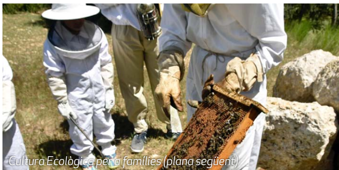
Cultura Ecològica per a famílies (plana següent)

C/Mestre Cabré, 9 · 43400 Montblanc · Tel. 696 718 135 · info@aromis.cat